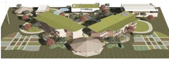
Figura 6. Vista Aérea – Escola Verde.