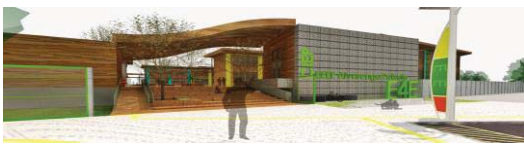
Figura 4. Acesso Principal – Escola 4 Elementos. Fonte: Dos autores, 2015.

Toda as edificações, bem como sua estrutura, foram projetadas com o uso da madeira (fig. 4), pois este é um produto sustentável (se acompanhado de provas documentais que garantam sua origem legal e não predatória), natural e oriundo de uma fonte plenamente renovável - a floresta -, e que deve ser reapresentado à sociedade atual como alternativa ecológica a materiais como metais, plásticos e compostos de cimento.