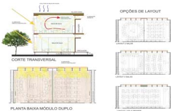
Figura 3. Módulo Classe de Aula – Escola 4 Elementos.

Toda as edificações, bem como sua estrutura, foram projetadas com o uso da madeira (fig. 4), pois este é um produto sustentável (se acompanhado de provas documentais que garantam sua origem legal e não predatória), natural e oriundo de uma fonte plenamente renovável - a floresta -, e que deve ser reapresentado à sociedade atual como alternativa ecológica a materiais como metais, plásticos e compostos de cimento.