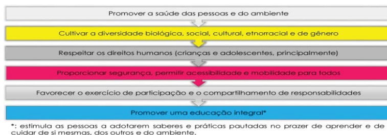
Figura 1. Papel de uma Escola mais sustentável.

Uma escola sustentável é uma escola inclusiva, que valoriza a diversidade, respeita os direitos humanos, visa proporcionar a qualidade de vida de todas as espécies e objetiva, conforme na figura abaixo: